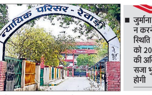
रेवाड़ी। जिला न्यायिक परिसर रेवाड़ी।