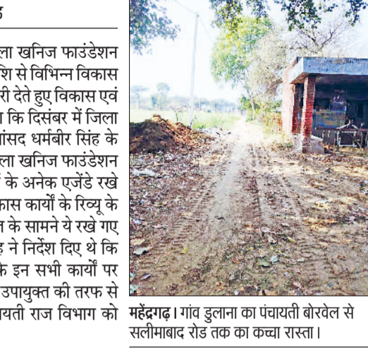
महेंद्रगढ़। गांव डुलाना का पंचायती बोरेवल से सलीमाबाद रोड तक का कच्चा रास्ता।