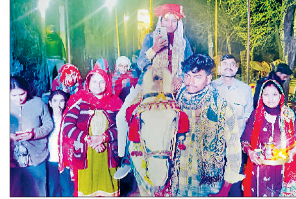
रेवाड़ी। बेटी का घोड़ी पर बनवारा निकालते परिन।

रबी की प्रमुख फसलों को इस समय बारिश की दरकार थी। जिले के किसानों ने इस बार लगभग 80 हजार हेक्टेयर भूमि पर सरसों और 35 हजार हेक्टेयर में गेहूं की फसल उगाई हुई है। मौसम इस बार किसानों पर मेहरबान रहा है। जनवरी माह में दो से तीन दिन तक पाला जमा था, जिसका गेहूं की फसल पर कोई बुरा असर नहीं पड़ा। एक दिन पहले हुई बारिश किसानों के लिए सोना के रूप में बरसी है। दोनों फसलों के लिए बारिश के लिए लाभदायी साबित हुई है। अभी गेहूं की फसल पर रोग की चपेट में आने का खतरा भी टल गया है, जिससे अच्छा फसल उत्पादन होने की संभावना बन गई है। बना रह सकता है। खुष्क मौसम का तापमान अभी और बढ़ेगा। रात के तापमान में भी आने वाले दिनों में वृद्धि होगी, जिससे सुबह और शाम के