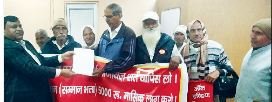
रेवाड़ी। डीडीपीओ को ज्ञापन सौंपते हुए संगठन के सदस्य।