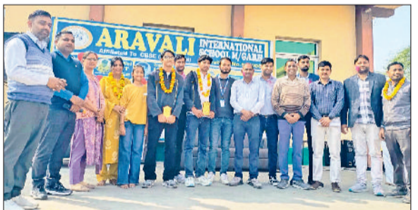
महेंद्रगढ़। खुशी जाहिर करते विद्यार्थी।

मामले में नया मोड़ तब आया जब यह खंडान में लाया गया कि पुलिस विभाग, पीडब्ल्यूडी और आईटीआई विभाग ने इन दुकानों पर अपनी मलकियत का दावा करते हुए न्यायालय में केस दायर कर दिया है। इस पर प्रधान ने कड़ा रुख अपनाते हुए सचिव को आदेश दिया कि तहसीलदार के माध्यम से तुरंत उचित भूमि की दोबारा पैमानाई करवाई जाए ताकि स्थिति स्पष्ट हो सके। नगरपालिका के वकील से परामर्श लेकर अन्य विभागों द्वारा किए गए दावों का मजबूती से जवाब दिया जाए। उच्च अधिकारियों को सभी लिखकर इस पूरे मामले से अवगत कराया जाए।