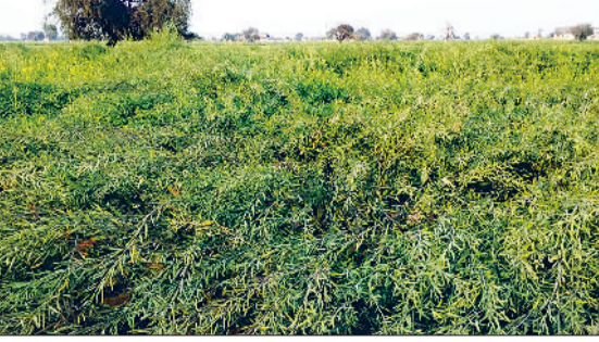
रेवाड़ी। एक खेत में तैयार हो रही सरसों की फसल।

दिन पहले ही बारिश होने के बाद तापमान में भारी गिरावट दर्ज की गई थी, जिससे ठंड ने कंपकंपी छुड़ा दी थी। आसमान साफ होते ही सूरज की चमक ने ठंड का असर कम कर दिया। वीरवार को अधिकतम तापमान 7.5 डिग्री सेल्सियस बढ़कर 26.5 डिग्री सेल्सियस पर पहुंच गया। रात का तापमान 4.6 डिग्री की गिरावट के साथ 9.3 डिग्री सेल्सियस दर्ज किया गया। रात और दिन के तापमान में अंतर बढ़ने के साथ ही ठंड का असर भी लगभग खत्म हो