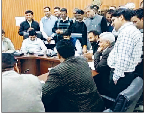
रेवाड़ी। सीएम के साथ वीसी करते अधिकारी व कॉलोनीवासी तथा भाड़ावास रोड स्थित आरओबी व तंग सर्विस रोड।