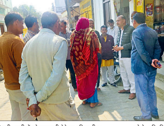
रेवाड़ी। ग्रामीणों को जानकारी देते हुए पुलिस टीम।