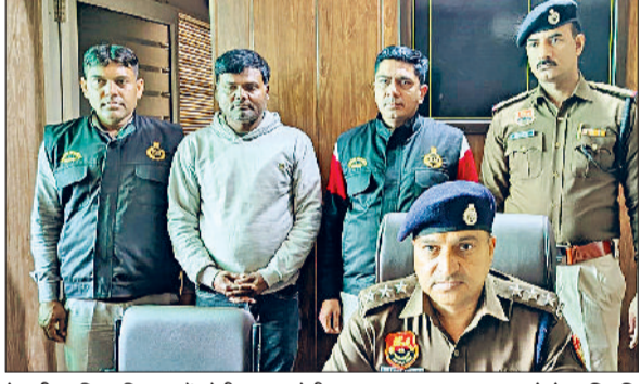
रेवाड़ी। पुलिस गिरफ्तार में चोरी का आरोपी।