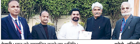
रेवाड़ी। छात्र को सम्मानित करते हुए अतिथि।